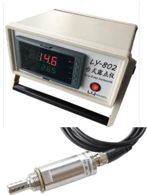
露点准确度 (精度图)